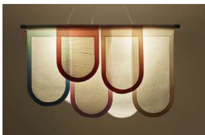
京表具（京都府） 弘誠堂