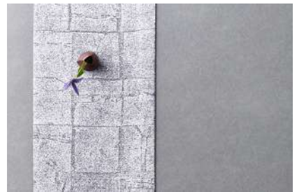
西陣織（京都府） 渡文 株式会社