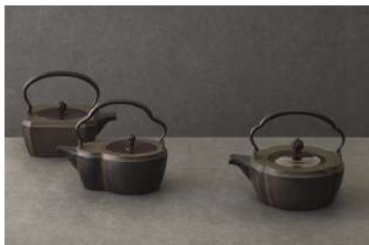
山形鋳物（山形県） 有限会社 鋳心ノ工房