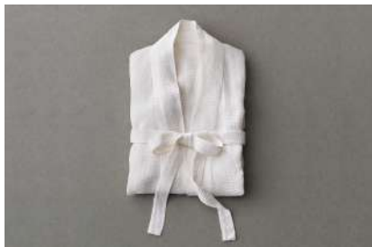
秩父銘仙（埼玉県） Magnetic Pole