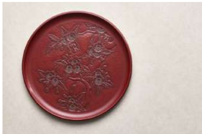
鎌倉彫（神奈川県） 有限会社 鎌倉彫山水堂