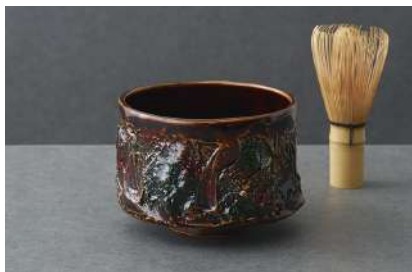
輪島塗（石川県） 輪島塗ぬり工房 楽