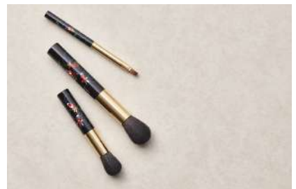
熊野筆（広島県） 広島筆産業 株式会社