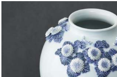
三川内焼（長崎県） 有限会社 平戸洗祥団右エ門窯