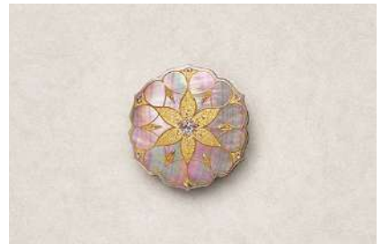
山中漆器（石川県） 株式会社 うるしアートはりや