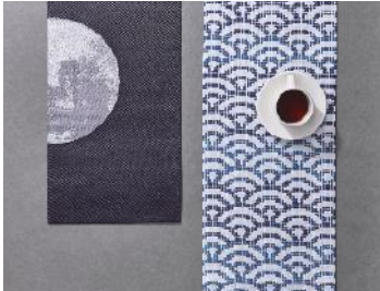
渡文株式会社（西陣織） テーブルセンター「青海波」と「月」

下記の写真をプレス用としてご用意しております。また、「DENSAN」のロゴマークもご用意しております。 プレス写真やその他のデータが必要な際は、プレス担当までお問合せください。