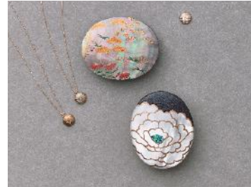
うるしアートはりや（山中漆器） 蒔絵アクセサリー「HARIYA」と「BISAI」