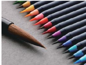
株式会社あかしや（奈良筆） 水彩毛筆「彩」