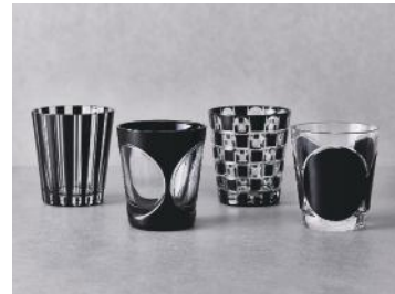
木本硝子株式会社（江戸切子） カットグラス「MOON」と「KUROCO」