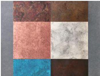
有限会社モメンタムファクトリー・Orii （高岡銅器） 銅/真鍮のタイル「ORII MARBLE」