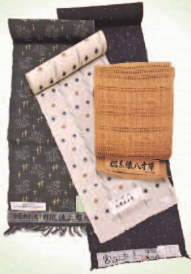
「自然布のきものと帯」

福島県 新布 (しなの木) 新潟県 越後上布 (麻) 沖縄県 宮古・八重山上布 (麻)