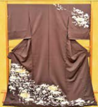
京友禅手描訪問着