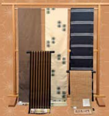
本場黄八丈 十日町紬 小千谷紬 しな布八才帯