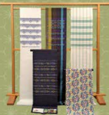
紅型染なごや帯 花織なごや帯