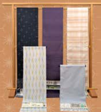
置賜紬 信州紬 明石縮