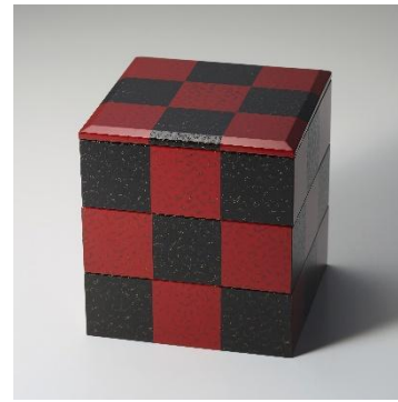
津軽塗 (青森県) 「市松唐塗 3段重」