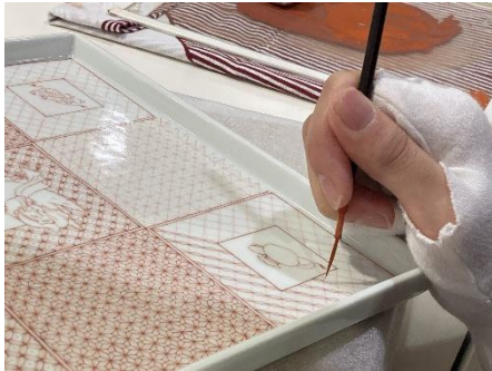
実演例 「九谷焼」絵付け

絵付けやろくろ成形、研ぎ出しなど、職人が毎日さまざまな実演を披露します。繊細な手仕事の技をぜひ間近でご覧ください。