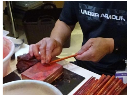
実演例 「津軽塗」研ぎ出し