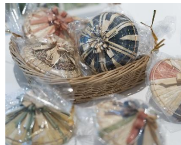
越中福岡の菅笠「豆笠作り」 伝統工芸の技術で小さい菅笠を作ります。