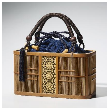
駿河竹千筋細工 (静岡県) 「手提げ 長角古代」