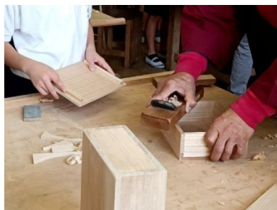
大阪泉州桐箆筒「桐箱製作」 幅 22 cm高さ 8 cm奥行き 17 cm程度の 桐箱を製作します。

大人だけでなく、お子様にも挑戦いただけるワークショップを開催。催場内の体験コーナーや該当工芸品のブースにてご参加いただけます。