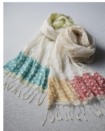
近江上布 (滋賀県) 「手織りネンストール」