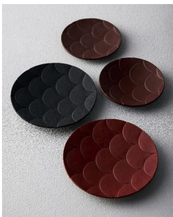
鎌倉彫 (神奈川県) 「うるこ皿」