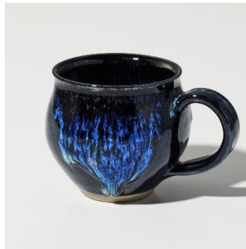
美濃焼 (岐阜県) 「清流油滴天目カップ」