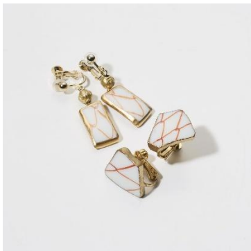
九谷焼 (石川県) 「九谷陶片 網目柄イヤリング」