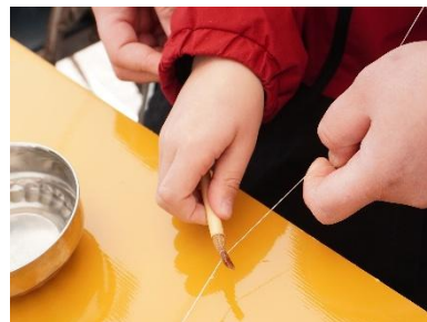
奈良筆「筆作りの仕上げ」 穂にのりをふくませ余分なりを糸でしぼり出し、 形を整える筆づくりの仕上げの体験です。