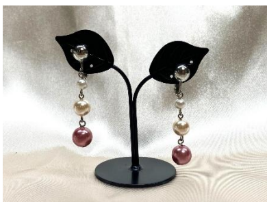
いずみガラス「アクセサリーとサンキャッチャー作り」 いずみガラスといずみパールを使用した アクセサリーとサンキャッチャーを作ります。